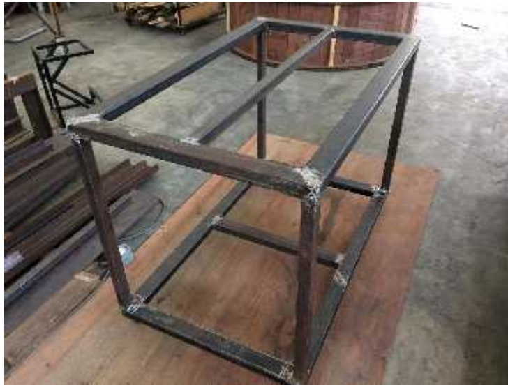
Figure 6: Iron rack/stand for placing dough fermenting basin or trays (50*70 cm width and length, 90 cm height and square hollow iron bar of 4*4 cm and 2 mm thickness)