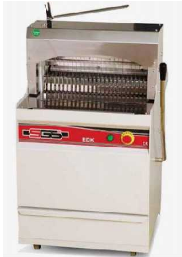
Figure 10: Dough (bread) cutting machine