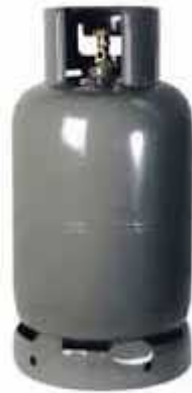
Figure 5: Gas cylinder (Butane Company)