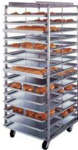
Figure 7: Plate transferring rack