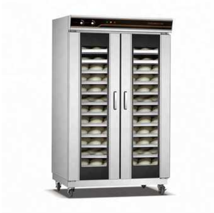
Figure 12: Dough fermenting/leavening chamber