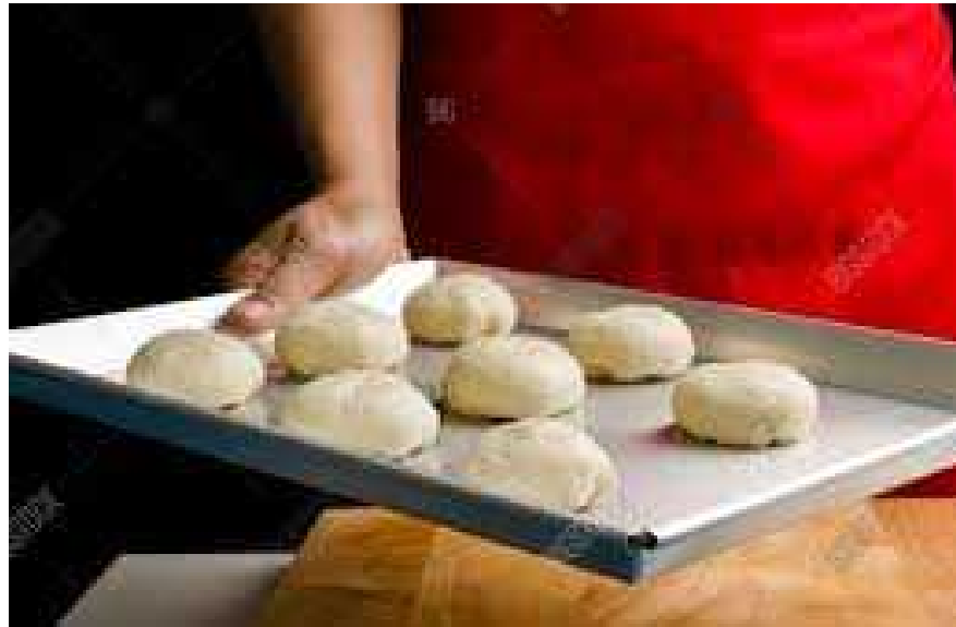
Figure 11: Iron plate (tray) compatible with rack given in figure-7.