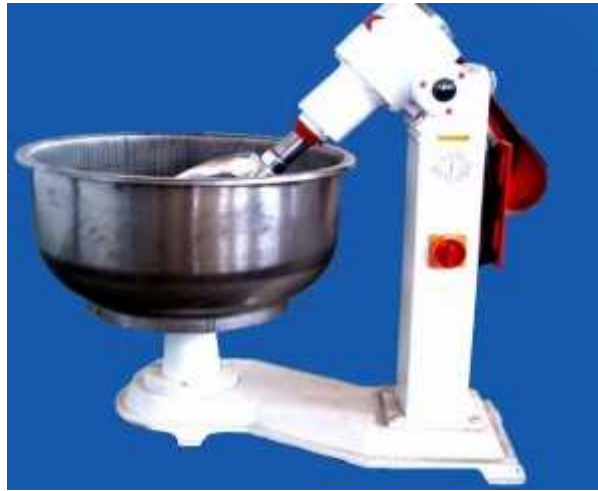
Figure 2: Kneader for flour (120 kg, Gul Parwar Asfahan Company, single phase)