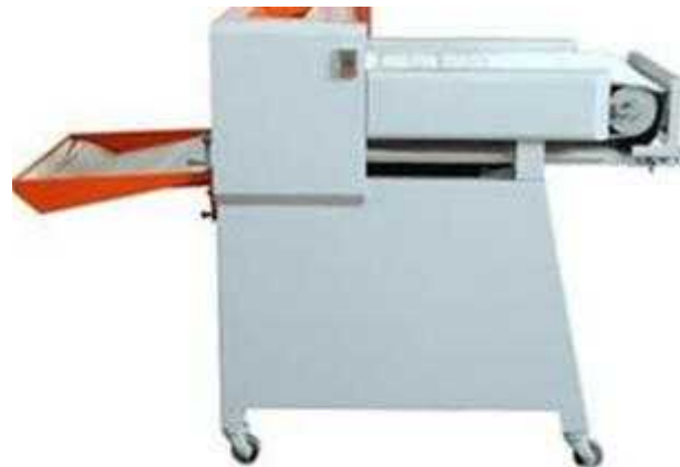
Figure 9: Flour rolling machine for burger bread