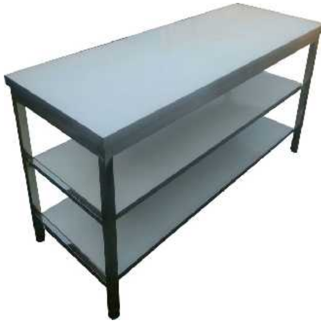
Figure 4: Stainless steel table (100 cm width x180 cm length and 90 cm height)