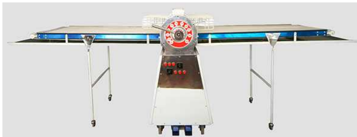
Figure 1: Roller (Gul Parwar Asfahan Company, single phase with two sided through table)