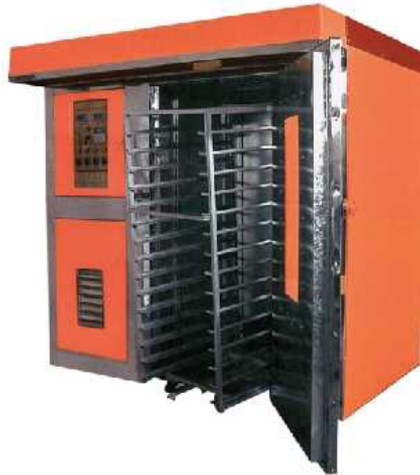
Figure 3: Gas oven with 32 layered rack/trolley capacity having electric control system and diesel/gas combustion system.